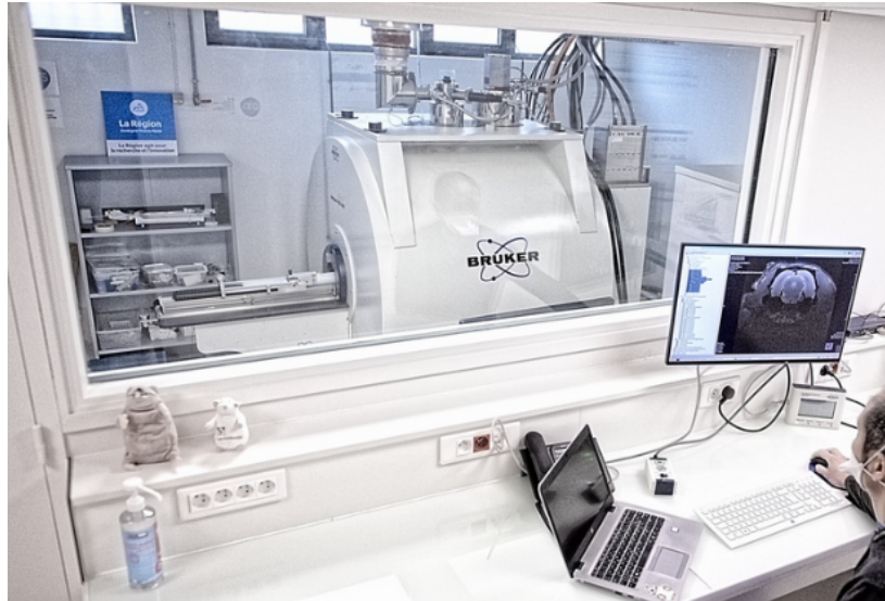
FIGURE 2 – IRM pré-clinique 11.7T de la plateforme PILOt sur lequel seront testées les impulsions générées.